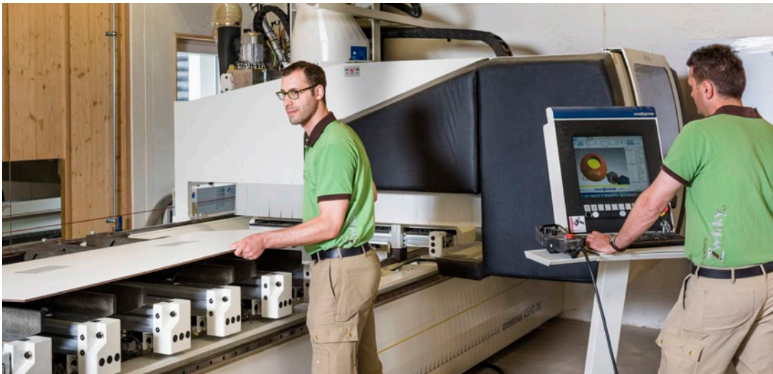
Mit der 5-Achs-CNC-Maschine werden komplexeste Elemente präzise und schnell hergestellt.

Inbetriebnahme der CNC-Maschine gibt es keinen Schreinerei-Auftrag, den das Unternehmen nicht ausführen könnte – termingerecht, massgeschneidert, präzise!